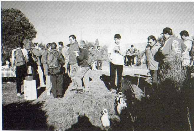
El Parany (esmorzar)