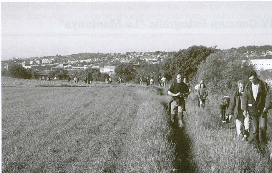
Participants al seu pas per Llerona.

l'aturada per esmorzar i aprofitar el lloc amb perspectiva visual i gaudir dels frondosos camps de cereals, amb diferents tonalitats de verd. Continua la caminada per can Tarafa, seguint un tram del GR 97.1, la carena de can Sora, Can Sora, la Miranda d'en Punes on es troba l'avituallament de les maduixes, can Granota i arribada a la plaça de l'Església, ja que a la Porxada es celebrava el concurs de sardanes organitzat per l'Agrupació Sardanista.