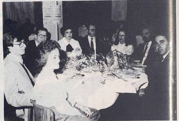
Representantes del C. Atlético Granollers con su Presidente señor Pous.