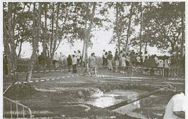
El joc de Colles va ser d'allò més brutal.