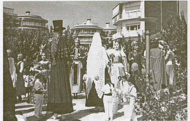
Gegants de moltes contrades ballaren pels nostres carrers.