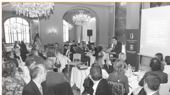
Presentació de l'OSVA a entitats i empreses, el passat mes de gener

En l'àmbit dels projectes de salut pública , s'està treballant en una acció per fomentar l'exercici físic, i des de l'àrea de projectes socials , s'organitzen activitats lúdiques i culturals. També s'estableixen col·laboracions amb entitats de la ciutat, com per exemple les que es duen a terme amb voluntaris de l'Hospital que fan atenció sanitària a esdeveniments esportius populars, com la Granollers Cup o la Mitja Marató de Granollers.