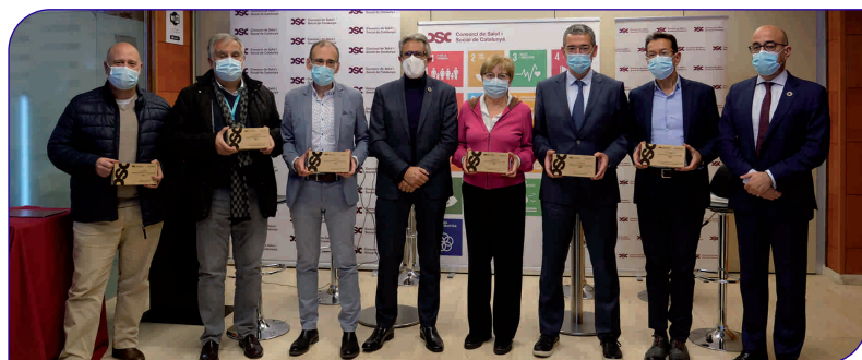
Foto de família dels representants dels hospitals guardonats