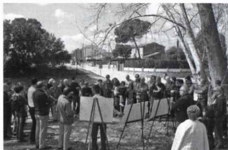
Inauguració del nou Gual de Sant Isidre.