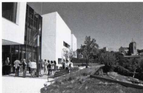
La nova Biblioteca inaugurada enguany.

S'aprova una operació de crèdit de 890.000 € per al finançament parcial d'inversions. Prospera una moció de rebuig de les sentències del Tribunal Suprem contra la immersió lingüística a les escoles catalanes. Es fa l'aprovació de l'inventari municipal. Es ratifica l'acord del Pla d'Acció de l'Energia Sostenible. Es dona llum verda inicial al projecte bàsic-executiu del desdoblament del pavelló poliesportiu. S'adjudica l'execució del pla de millora de l'espai fluvial del riu Tenes a l'empresa Barnasfalt, per un import de 1.208.460,70 €. Es constitueix el nou Ajuntament que va sorgir de les eleccions municipals del maig. El candidat de CiU Joaquim Brustenga n'és escollit alcalde. Regidors: Miquel Moret Espinosa, Isabel Valls Bassa, Araceli Polo Velasco, Joan Iglesias Barcia, Cristina Parera Sallent, Pere Cabot Barbany, Ramón Vilageliu Relats, Núria Federico Fuertes, Joaquim Blanch Conejos, Martí Ferrés Ollé, Francesc Montes Casas, Agustín Gonzalo Álvarez. Es canvia el model de recollida d'escombraries, que passa del Residu mínim a les 5 fraccions. Es concerta una modificació de crèdits per un import de 1.453.606 € i 258.000 €.