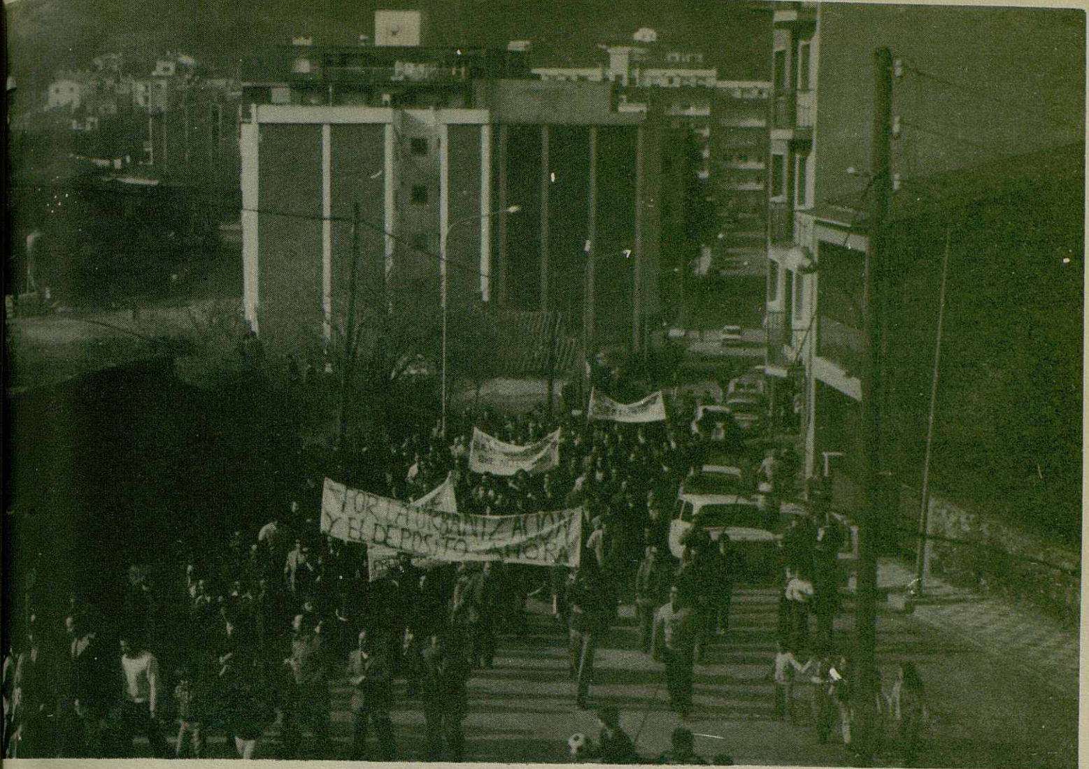
Los vecinos del Polígono Riera Marsa se manifiestan

PIDEN SOLUCION AL PROBLEMA URBANISTICO Y DE FALTA DE AGUA