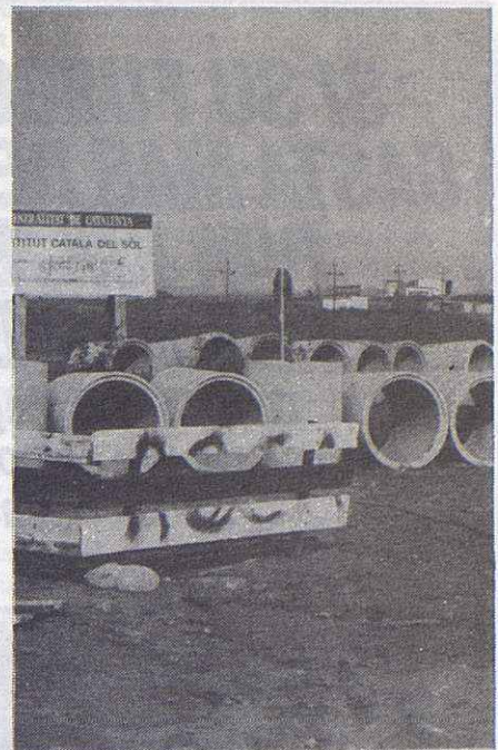
Al sud de la B-30