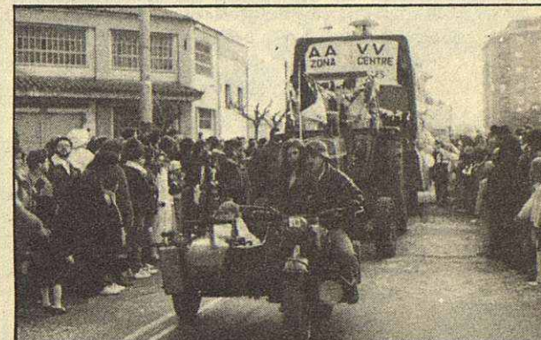
La AA.VV. de la zona centro se apuntó a la fiesta.