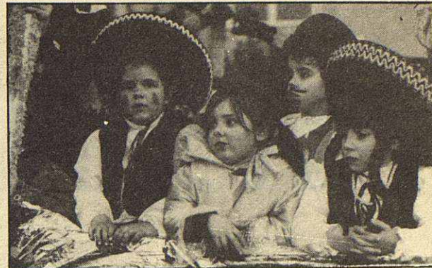
Los niños se dejaron notar con sus atuendos.