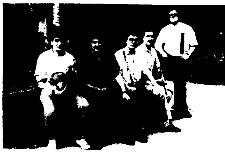
Quintet de vent Harmonia

Aquesta gira, que té com a punt de sortida la ciutat de Granollers, està inclosa dins la darrera fase del mencionat programa de foment i hi participen els grups de música que van ser seleccionats en finalitzar l'Estada Internacional de Música de Cambra, realitzat a Torrebonica (Barcelona) amb la participació de 72 grups dels quals 26 en van ser pre-seleccionats. Posteriorment, d'aquests grups van ser convidats a la Setmana de Música de Cambra, celebrada a Barcelona, amb la participació de grups professionals de música de cambra. Aquesta gira significa pels orga-