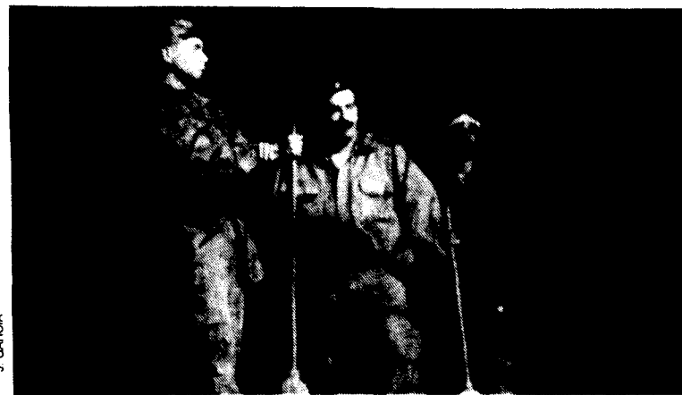
Una escena de l'obra "Històries de la puta mili"

El grup Catalana de Gags, que té sis actors, va interpretar còmicament diferents escenes del Servei Militar, com ara el reclutament de joves (diferents disfresses que s'utilitzen per lliurar-se de la mili), el camuflatge (l'inconvenient de les necessitats fisiològiques a l'hora de camuflar-se), el Mur de Berlín (dos catalans fent guàrdia) els mariners aprenent les diferents parts d'un vaixell (amb un traductor al llenguatge