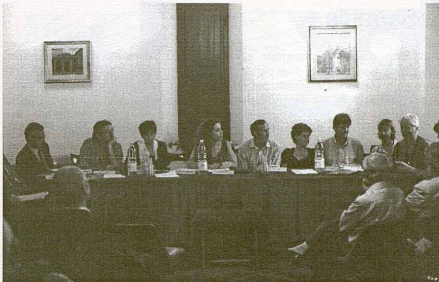
Trobada dels quatre arxius memorístics.

l'Arxiu de Pieve St e Stefano ens va obrir les portes, oferint-se a col·laborar amb nosaltres, fent-nos partícips de la seva experiència de 14 anys d'existència de l'arxiu.