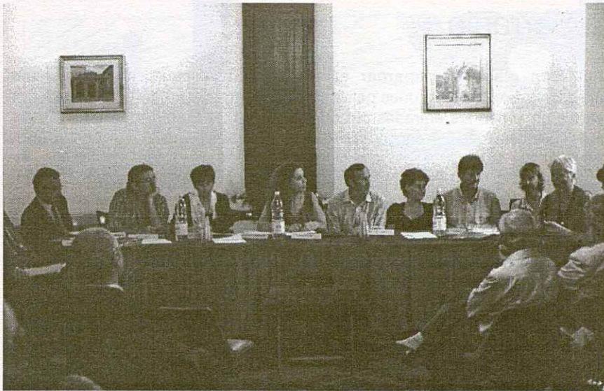
Trobada dels quatre arxius memorístics.

l'Arxiu de Pieve St o Stefano ens va obrir les portes, oferint-se a col·laborar amb nosaltres, fent-nos partícips de la seva experiència de 14 anys d'existència de l'arxiu.