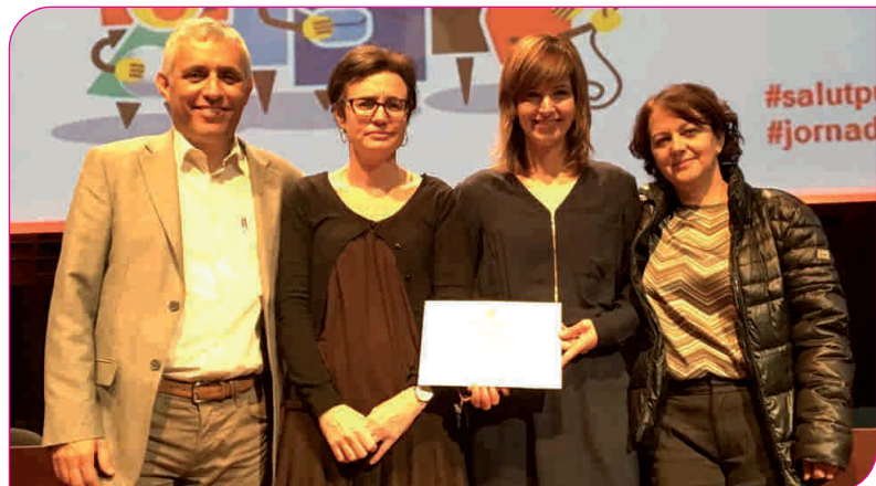
Els representants del programa We love eating, amb el guardó

El We love eating és un programa europeu desenvolupat per professionals de l'Hospital General de Granollers, l'Ajuntament i l'Institut Català de la Salut durant els anys 2014 i 2015 a Granollers conjuntament amb 6 ciutats més de diferents països, que té l'objectiu de promoure estils de vida i una