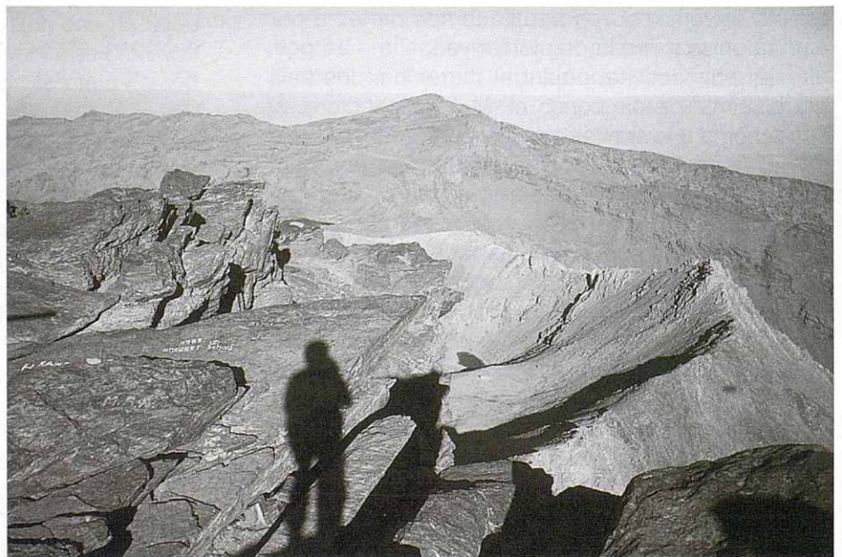
Veleta, Puntal de la Caldera, etc. des del Mulhacén.

trobar el desguàs del darrer estany per trobar el