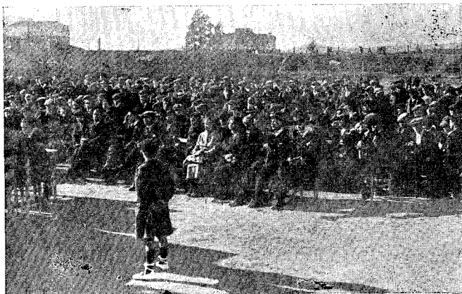
El públic que assistí al important acte nacionalista celebrat a Granollers