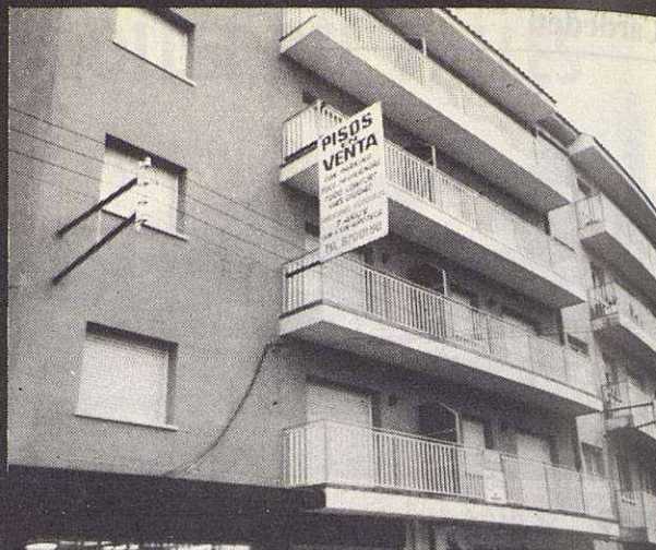
Con acabados perfectos