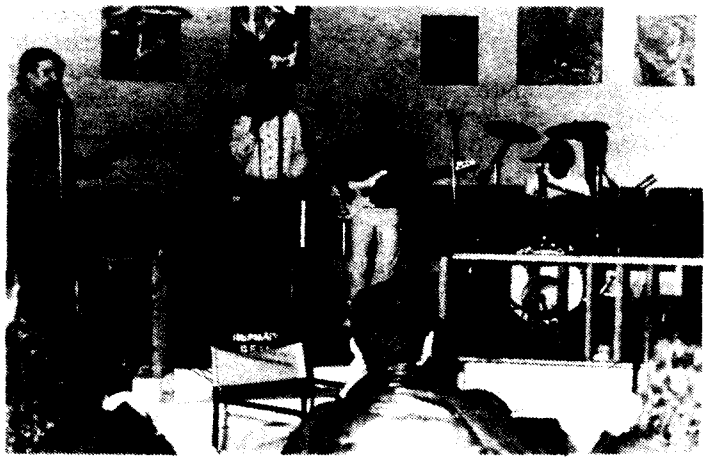
"D'Estranquis", de Mataró, en el Concert del passat dijous al Cargol Pelut de Parets