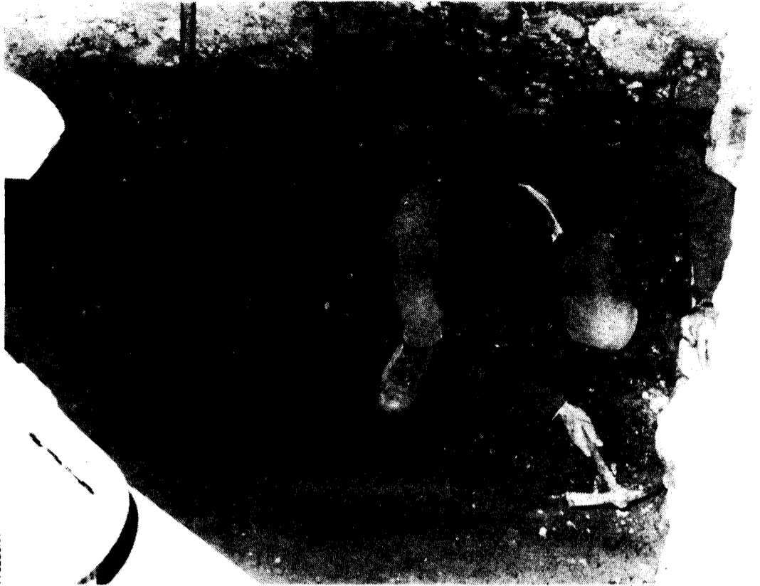
La primera fase de les obres de Can Pedrals estan molt avançades

Per aquesta categoria de Cap de Zona que té la biblioteca de Granollers necessita uns serveis més amplis així com més personal del que hi ha ara a la bibliote-