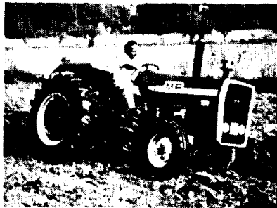
MF 275 (4 versiones)