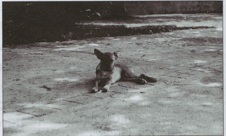
Cualquier perro suelto en la vía pública es una falta penada con hasta 750 euros.

Sobre este asunto una advertencia a los propietarios de perros: no hace falta que el perro sea potencialmente peligroso para que los agentes multen. Está prohibido soltar a ningún perro en la vía pública, parques o jardines. Un minúsculo Yorkshire también puede ser multado. Las ordenanzas municipales dicen que como falta leve, y las faltas leves pueden alcanzar los 750 euros, sí han leído bien, 750. Ocurre que este tipo de sanciones no pasan por el pleno y, por lo tanto, no hay información pública de estas sanciones.