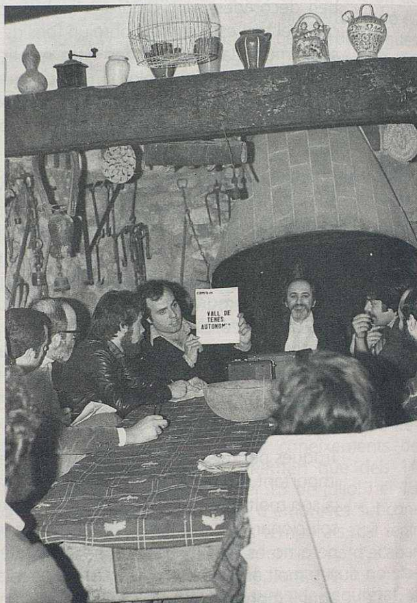
Presentació als periodistes de la imminent "Volta en carro als Països Catalans", l'abril de 1978, a Can Maspons de la Vall.

Calia, però, resoldre dos punts importants: el lloc i el menú. Havíem de trobar un lloc avinent i un menú econòmic. Després de quatre o cinc assajos en un altre local amb problemes concrets i interferències televisives, vam decidir-nos per la Cruïlla, que llavors encara se'n deia El Crus. La Cruïlla, que era un local modest, amb poques pretensions, es va convertir en centre neuràlgic del "Pa amb Tomàquet". S'hi van succeir les conferències, els sopars frugals però suficients, les converses... Molts