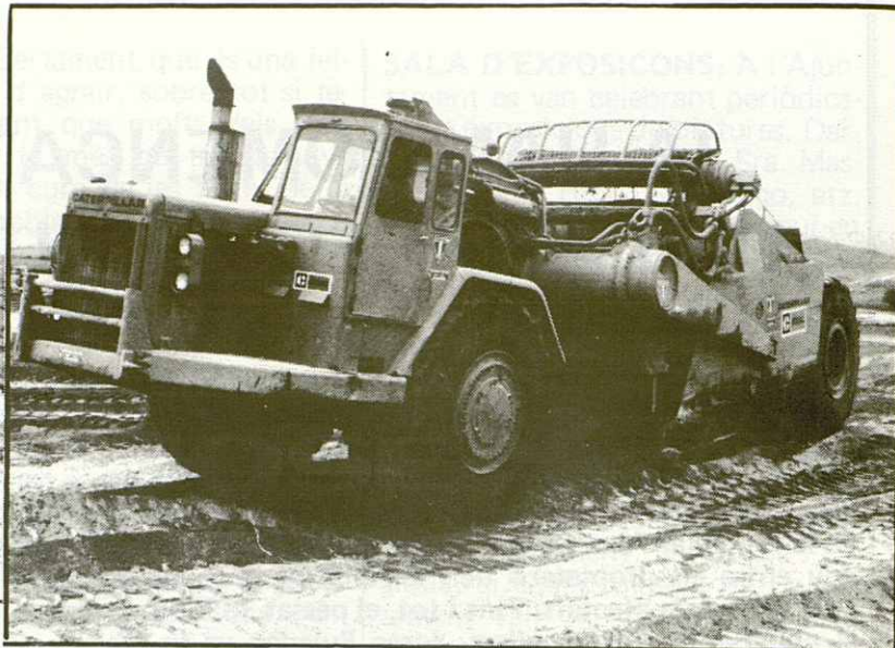
Panoràmica d'una de les màquines utilitzades pel rebaix de terres.

terme municipal de La Roca del Vallès, fins i tot i tot cas que el verdader límit entre els termes municipals de La Roca i Granollers fos el sostingut per l'Ajuntament de Granollers. Per tot això no s'entén massa el perquè del decret abans esmentat, d'eficàcia nula.