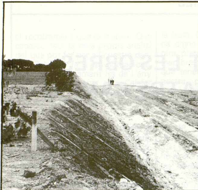
Estat del terreny de Quatre Camins després dels primers treballs de rebaixament de terres.