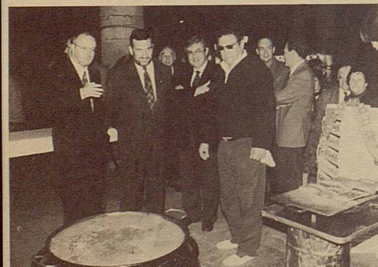
Mostra del Peix Blau