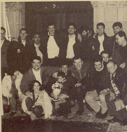
Els jugadors del BM Granollers a la Porxada, després de guanyar la Copa Asobal