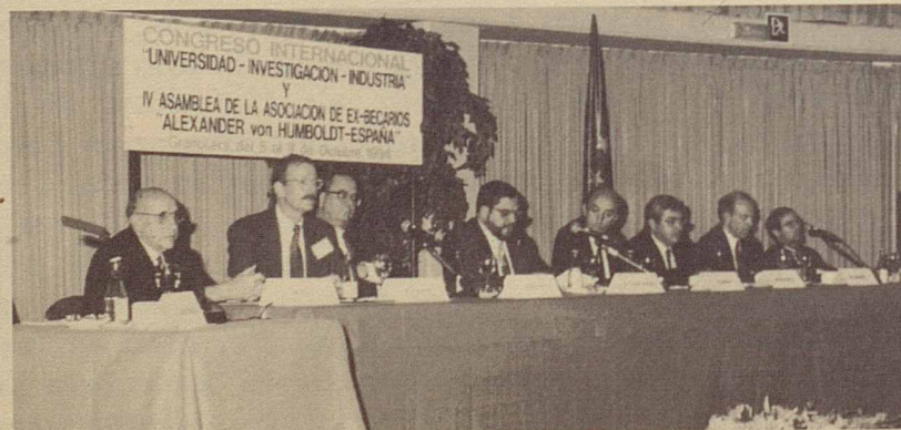
IV Assemblea d'ex-becaris de la Fundació von Hunboltd