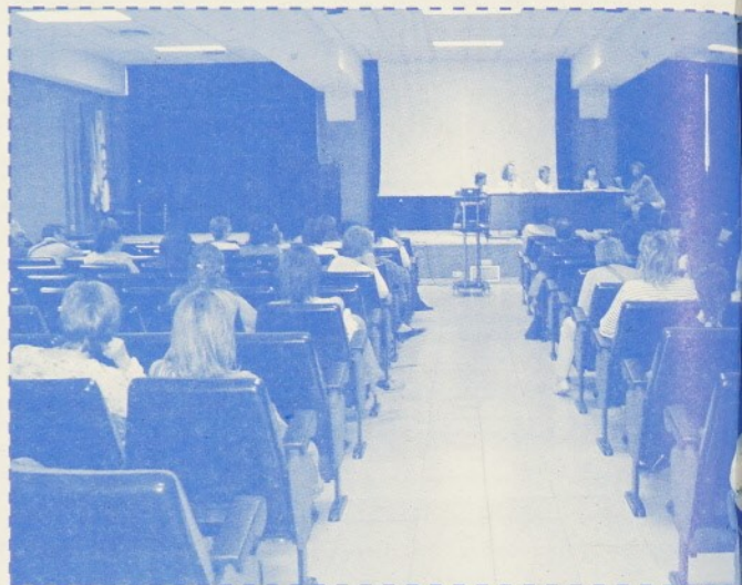
Aquesta Jornada està reconeguda per l'Institut d'Estudis de la Salut de la Ge

Les caigudes accidentals van ser el tema central de la III Jornada Sociosanitària del Vallès Oriental,