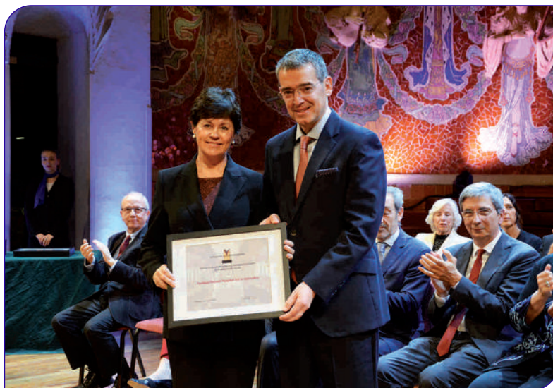
Moment del lliurament del premi en el marc incomparable del Palau de la Música Catalana

Aquest compromís ha permès a la institució dissenyar projectes i