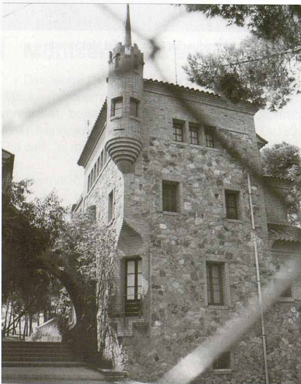
La Casa del Mestre.

És ben veritat que cada època històrica conté moviments socials contraris, la tensió entre els quals genera vitalitat, entusiasme, creativitat, passió, lluita, respecte...; la Colònia Güell en pot ser un clar exponent, perquè planteja el sistema social seguint l'ordre tradicional de la propietat i la jerarquia en el qual les persones destacaven segons els estudis, els càrrecs i responsabilitats en la fàbrica; aquest ordre social es manifestava en els tipus de cases.