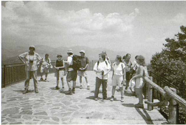
Serra de Catllaràs - Mirador d'El Roc de la Lluna.

cases noves de les Coromines, la Pobla de Lillet. (A la serra del Catllaràs és dels pocs indrets de Catalunya on es troba la Flor de Neu o Edelweis, nosaltres en vàrem veure).