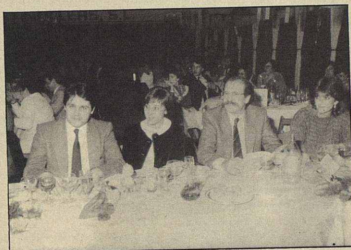
Mesa del señor Josep Montal, concejal del Ayuntamiento y diputado por el Parlamento de Catalunya y acompañantes.