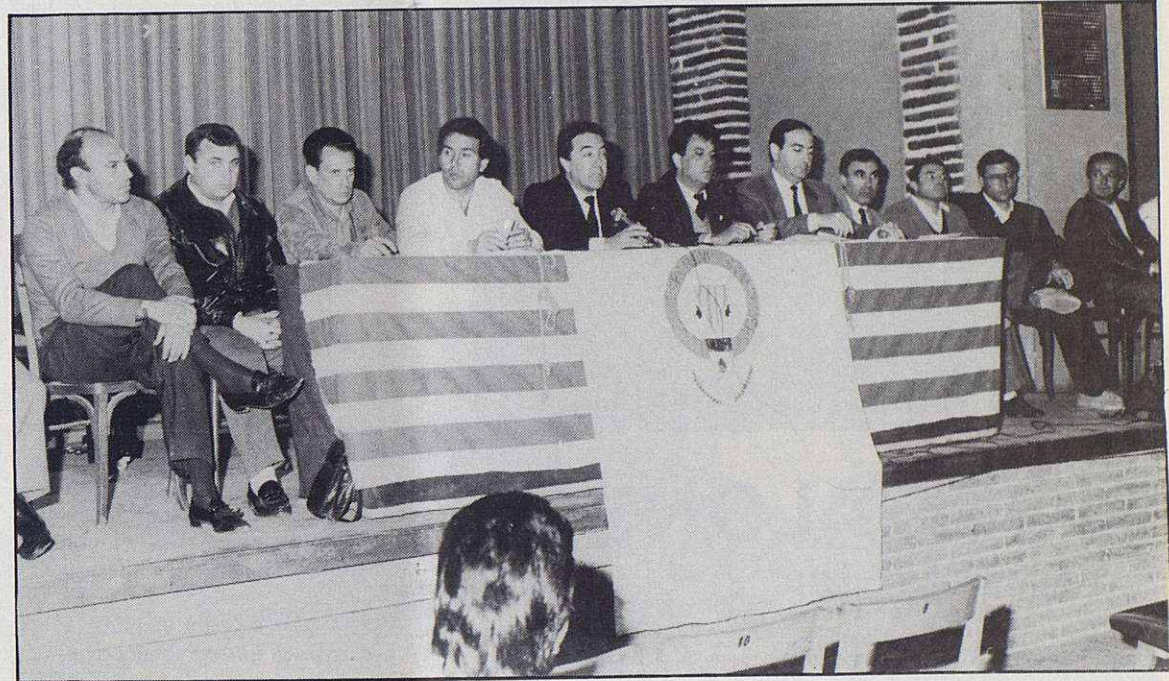
Junta directiva del E.C. Granollers, que durante cuatro años ha llevado las riendas del club con resultados altamente positivos. La fotografía fue tomada en la última asamblea informativa.