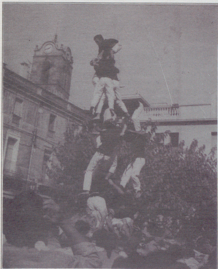
XICS DE GRANOLLERS. Llenya del 3 de 7 de la Trobada de Colles del Vallès. Mollet, 1993.

Ja tornem a ser aquí per explicar les nostres peripècies en aquests móns de Déu, com a colla casteller. Durant les nostres actuacions han passat coses divertides, però també hi ha hagut algunes ocasions per a la tristesa; en altres casos hem tingut una actuació model, sense cap mena d'incidents. Per aquesta raó, en aquesta ocasió ens dedicarem a recordar aquelles actuacions més destacables o, perquè no, les més ruino-