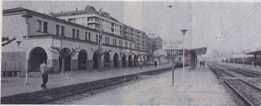
Estació de França: Impedir l'entrada del tren conflictiu

Preocupats pel que podria ser una tragèdia, els veïns del barri de Sant Miquel posen en alerta a tota la població. El tren carregat de propà s'estaciona cada dia a Granollers tota la nit