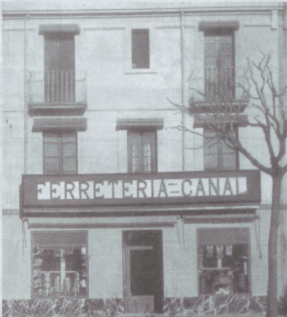
Ferreteria Canal (1901), a la plaça Maluquer i Salvador.