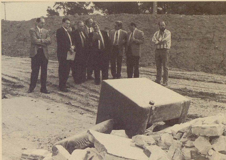
Nova estació de transferència de runes al camí Ral

d'escombraries i neteja viària a IACSA del grup BFI