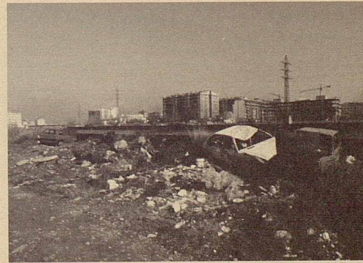
Neteja de 21 abocaments incontrolats