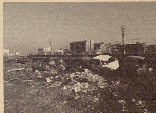
Neteja de 21 abocaments incontrolats