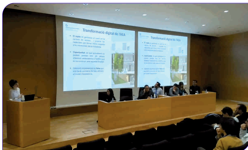
El projecte GHATA es va presentar en la jornada "Reptes i oportunitats en el sector salut: col·laboració públicoprivada"

Des de l'inici de la campanya, l'octubre de 2017, el Punt d'Informació de Consultes Externes és qui gestiona part de les incidències i en coordina les altes, que tenen una dinàmica de 235 noves altes per setmana.