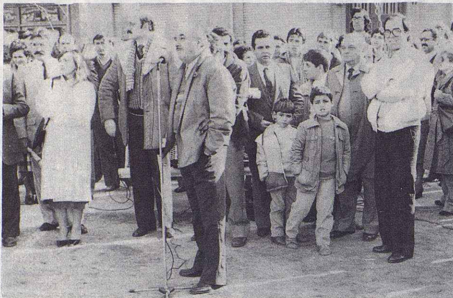
El presidente de "4 Barris" aprofità bé la inauguració