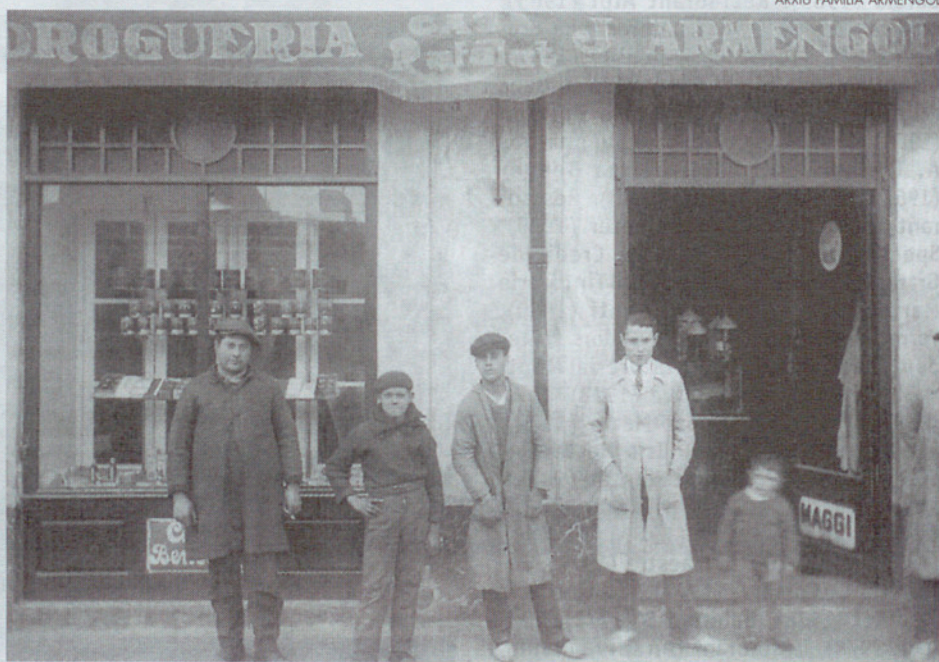
Drogueria Armengol (1913), es troba a la plaça Perpinyà.

La implantació d'aquestes grans àrees comercials (algunes d'elles situades en es-