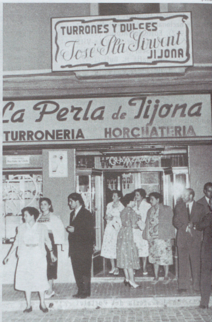
La Perla de Xixona (anys 50).

fet causat, en la seva major part, per la implantació dels grans centres comercials.