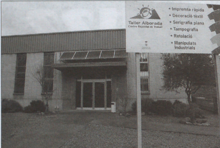
Vista exterior del edificio que alberga el Taller Alborada, en el barrio de Can Pantiquet.