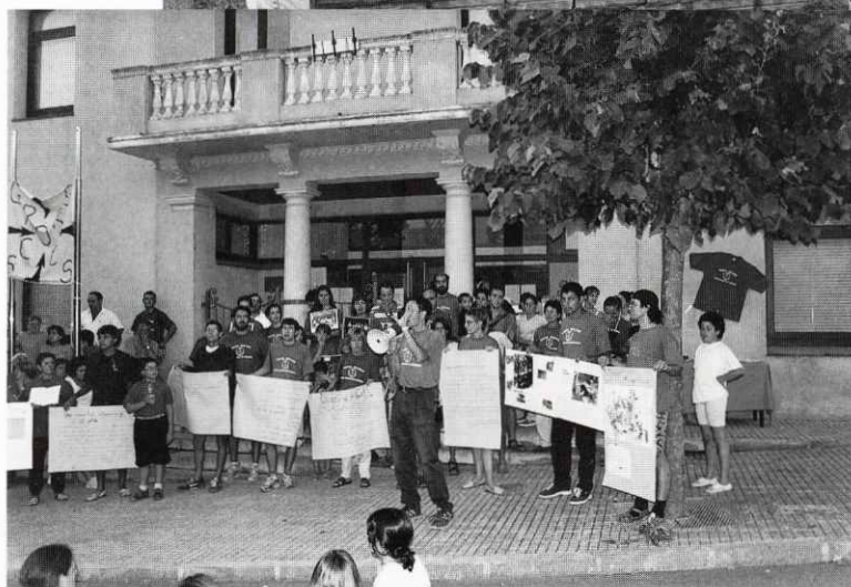
Els blaus presenten la prova cultural.