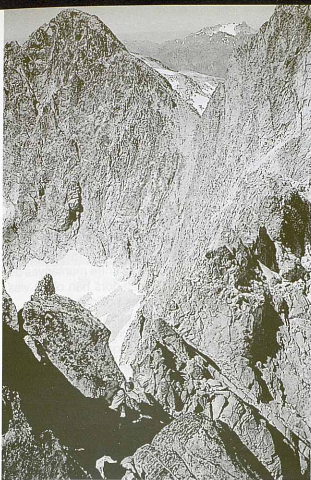
Baixant del Cim del RAMOUN. Al fons el TRES CONSELLERS i el VIGNEMALE.

des amb perfils estranys, des de l'Ariège fins a Navarra, les galeries dels tres mil més o menys llunyans. El Midi de Bigorre, sacrificat per la ciència, tancant l'horitzó d'una forma permanent cap al nord, darrera seu les vastes planures de l'Aquitània. Cap el sud l'horitzó polsós i calent de la Península darrera el llunyà Posets, Suelza i Cotiella.