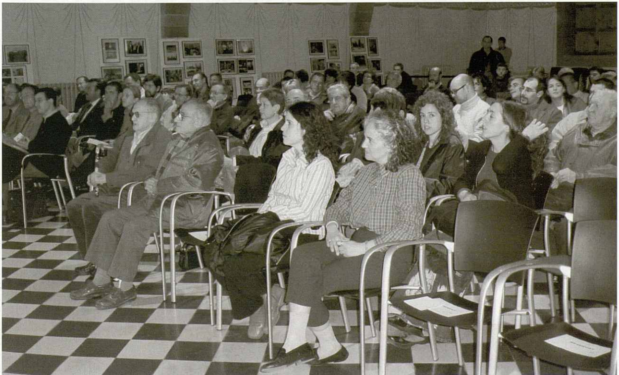
La Sala Tarafa de Granollers es va omplir de socis i amics en aquest acte de presentació.