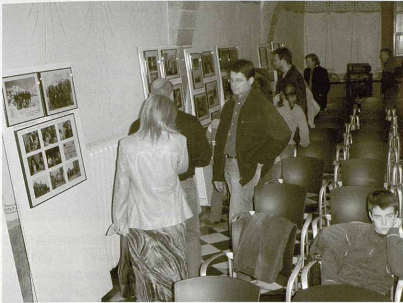
Exposició de fotografies retrospectives que feien una ullada del que ha estat l'AEG durant aquest 75 anys.