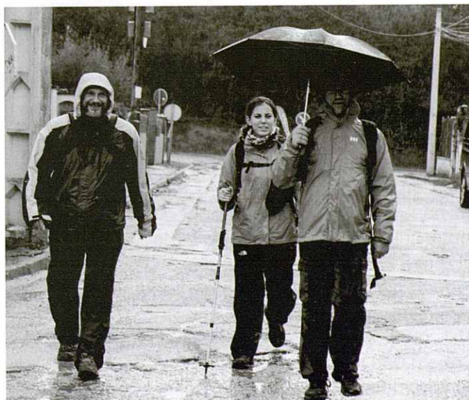
Marxadors sota la pluja a Cànoves.

L'itinerari va ser diferent, però res del que havíem previst. Vam haver de fer ús de "l'itinerari d'imprevistos", consistent a baixar dels auto-