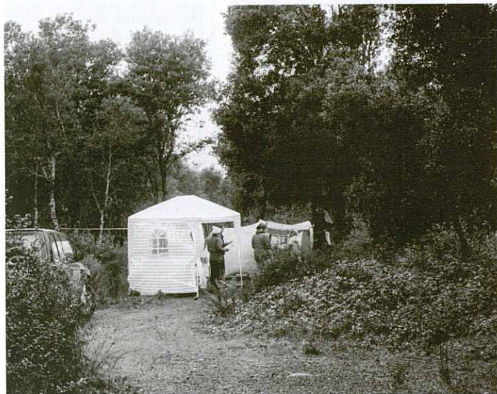
Control de Can Montasell.

previst. Res d'ascensió al Matagalls, que en aquelles condicions hauria estat un desastre.