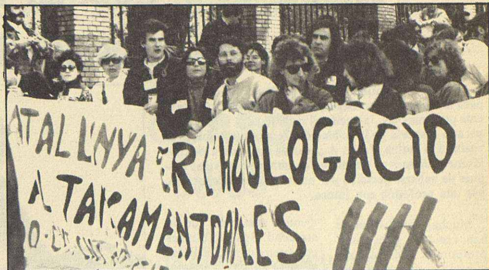
El pasado curso escolar fue un año polémico

«El fracaso escolar tiene múltiples y variadas fuentes y causas»