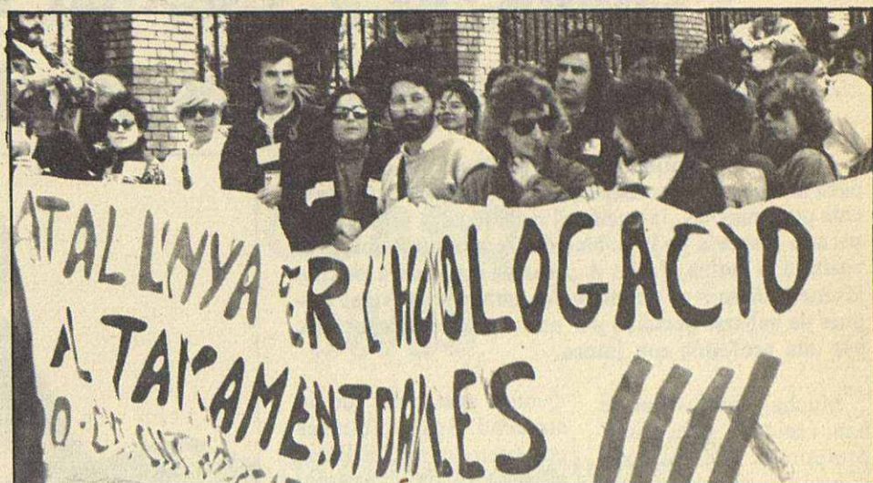
El pasado curso escolar fue un año polémico

«El fracaso escolar tiene múltiples y variadas fuentes y causas»