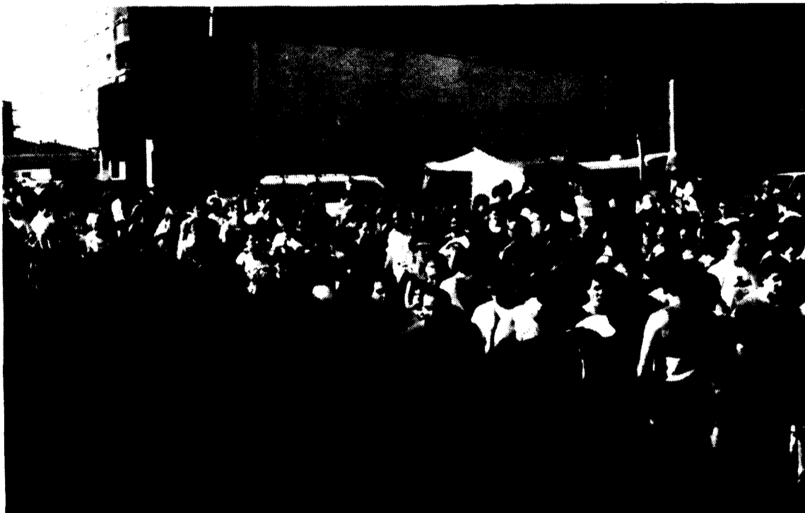
Sortida IIa Cursa de Fons de Montmeló (1989).

La idea d'organitzar la I MITJA MARATHÓ DE MONTMELÓ va sorgir arran de l'èxit de participació i organització que va assolir la II CURSA DE FONS celebrada l'any passat.