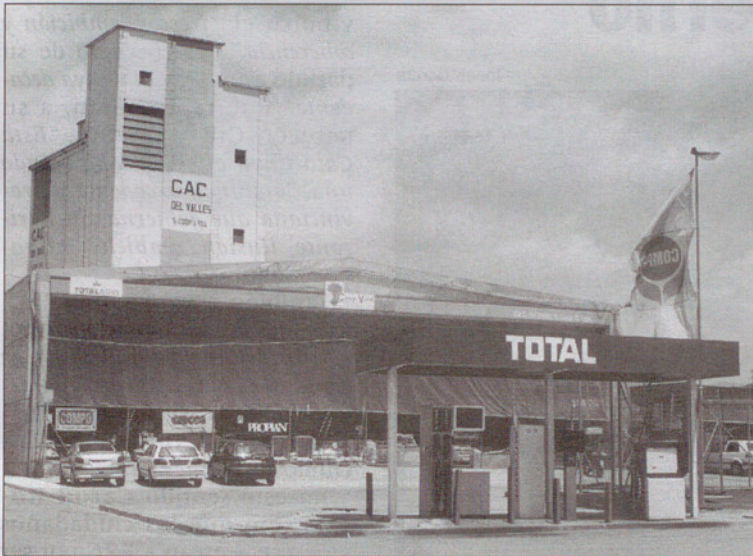
Edificio de la cooperativa.