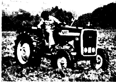
MF 245 (5 versiones)

Tracción de los puentes en los terrenos más difíciles.