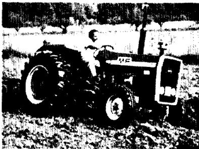
MF 275 (4 versiones)