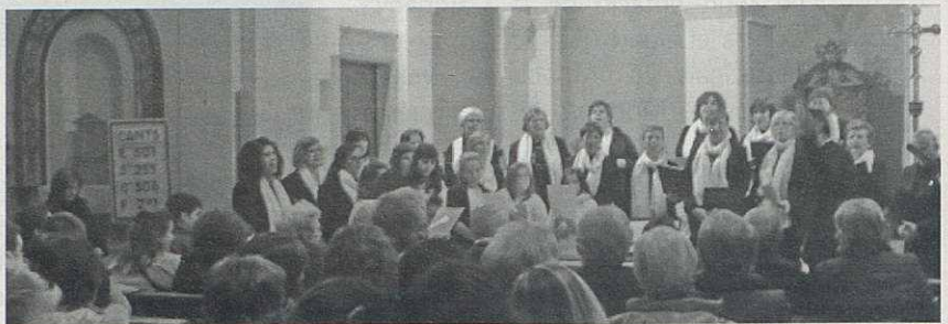
La Coral Infantil i la Coral Sant Vicenç en el concert de Nadal.