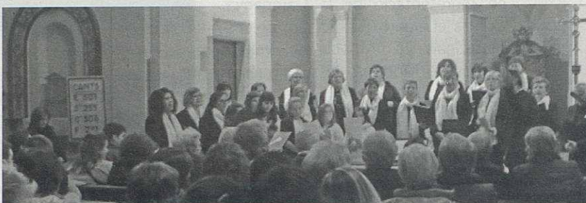
La Coral Infantil i la Coral Sant Vicenç en el concert de Nadal.