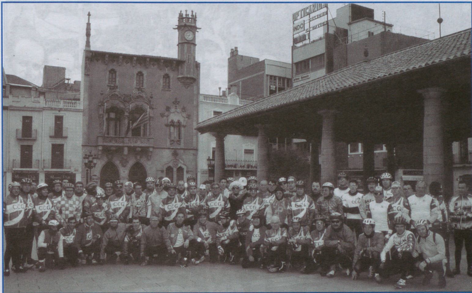
El 1977 el Club Ciclista Granollers es va refundar i va donar pas a l'actual entitat com es pot veure en aquesta foto dels anys 90 feta a la Pòrxada.

ninguna compensación de ostentación, hacen que siga latente el ciclismo de nuestra ciudad».