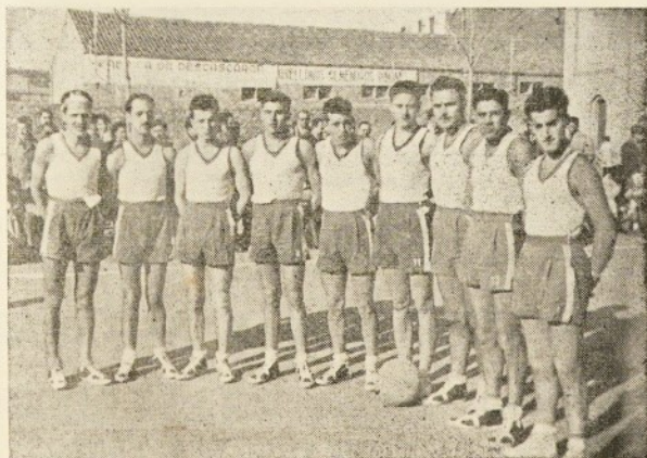
El equipo de E. P., que ha ascendido a primera categoría